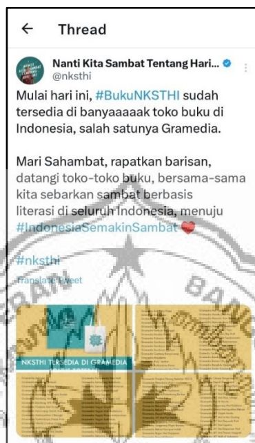
Gambar 2.3 : Promosi buku NKSTHI