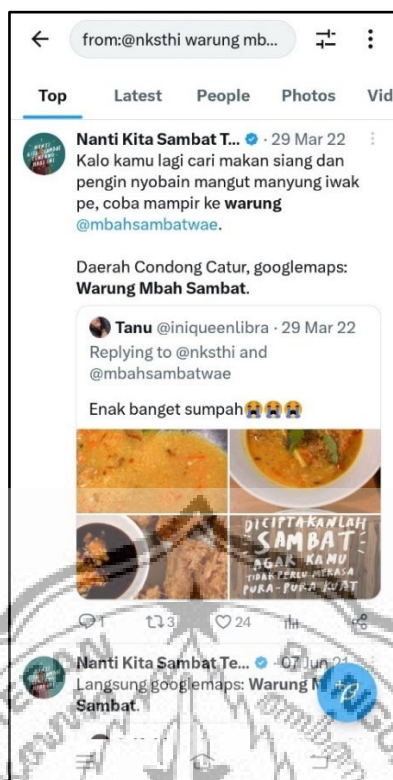
Gambar 2.6 : Promosi Warung Mbah Sambat