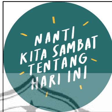
Gambar 2.1 : Logo akun Twitter @nksthi