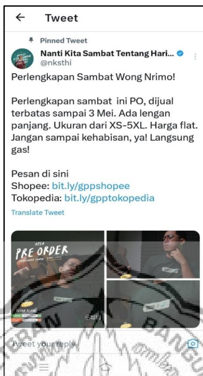
Gambar 2.5 : Kegiatan promosi clothing line Toko Sumber Sambat

Toko Sumber Sambat adalah merchandise store dari NKSTHI yang menjual berbagai perlengkapan sambat untuk memenuhi kebutuhan Sahambat (pengikut akun NKSTHI) dalam hal fashion dan lifestyle . Toko Sumber Sambat menjual merchandise seperti T-shirt , Stiker, Totebag , Pouchbag , Pin Enamel dan Masker.