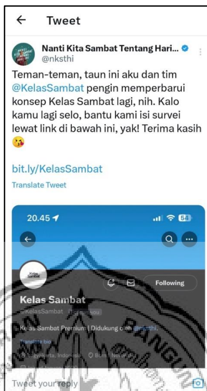
Gambar 2.4 : Promosi kegiatan Kelas Sambat