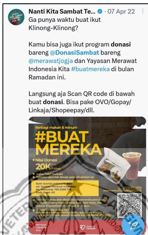
Gambar 2.8 : Kegiatan Donasi Sambat

Kegiatan Donasi Sambat didirikan pada tahun 2021 dengan di dukung oleh Yayasan Merawat Indonesia Kita. Donasi yang disalurkan berupa makanan untuk para pekerja di jalanan seperti tukang becak, tukang sapu, loper koran, pedagang kaki lima, dan lain sebagainya.