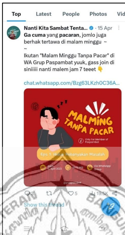
Gambar 2.7 : Kegiatan Paspambat