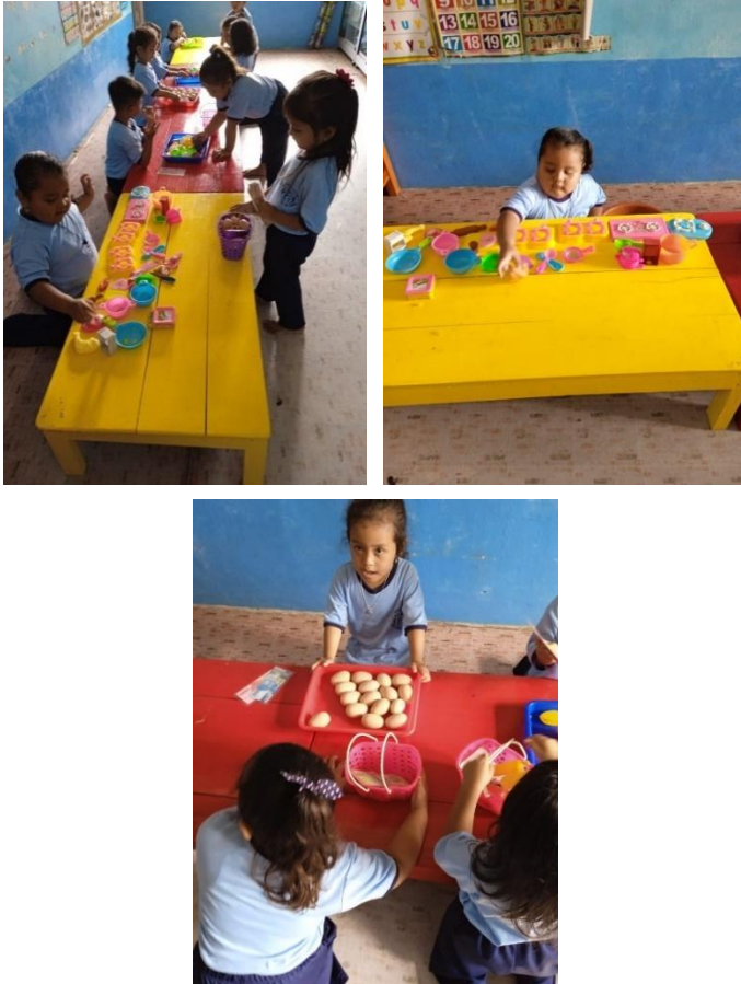
Gambar 4.4. Kegiatan Pendidikan Kewirausahaan di KB Margo Utomo 3

Solusi atas permasalahan terakhir, yaitu referensi, pendidik lembaga PAUD melengkapi referensi materi pendidikan kewirausahaan yang mendukung dengan melakukan kunjungan ke perpustakaan, pameran-pameran kewirausahaan dan pelatihan-pelatihan seperti yang dilakukan oleh pendidik PAUD Pelangi Nusantara 05. Pendidik lembaga PAUD lainnya juga melakukan hal yang sama dan berusaha agar pemahaman pendidik dapat bertambah tentang pendidikan kewirausahaan anak usia dini.