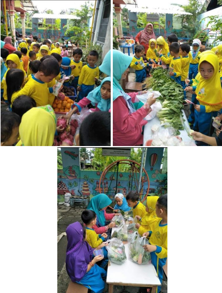
Gambar 4.3. Proses Jual Beli di Lembaga PAUD Pelangi Nusantara 05

Namun demikian, ada juga lembaga yang menggunakan model pembelajaran kelompok saat penyampaian materi kewirausahaan seperti KB Anak Genius sesuai penuturan Ana Istiani "...model pembelajaran kami kelompok saat penyampaian materi kewirausahaan...". Metode pembelajaran yang digunakan oleh PAUD Tunas Mulia sesuai penuturan Sri Rahayu, pendidik,