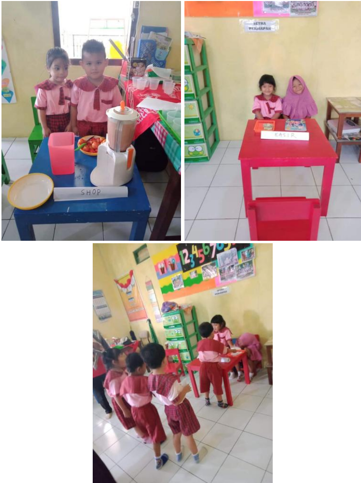
Gambar 4.2. Pendidikan Kewirausahaan di lembaga KB Anak Genius

Dari hasil wawancara mendalam dengan informan, maka didapatkan gambaran bahwa penyelenggaraan pendidikan kewirausahaan di lembaga-lembaga PAUD di Kabupaten Semarang masih memerlukan pengembangan model, pendekatan pembelajaran yang sesuai dengan karakteristik anak usia dini. Pengembangan media pembelajaran juga perlu mendapatkan