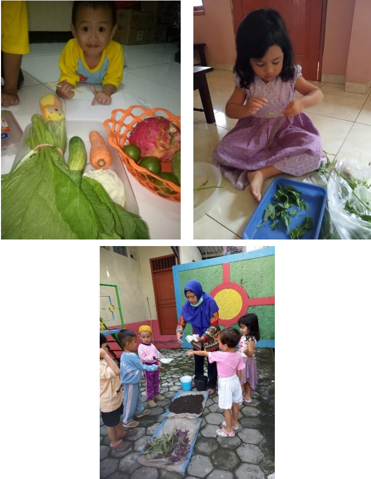
Gambar 4.1. Pendidikan Kewirausahaan di Lembaga PAUD Tunas Mulia

Poin kedua pada wawancara, yaitu materi kewirausahaan yang diberikan pada peserta didik dan kendala yang dihadapi. Sepuluh responden rata-rata menyatakan bahwa materi pendidikan kewirausahaan yang diberikan adalah seputar jual-beli, kecuali pada lembaga PAUD Koronka yang mengadakan visitasi ke sentra-sentra industri/pertanian sebagai pembelajaran kewirausahaan seperti penuturan Rita Dwi Haryanti: